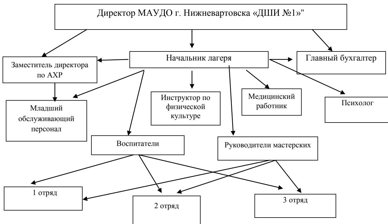
Схема управления лагеря

Таким образом, кадровый состав лагеря представлен опытными, творчески активными работниками, отвечающими требованиям к уровню образования и имеющими достаточный опыт работы.